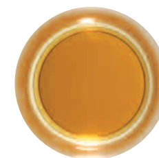
Avec Bellima®: un thé clair, pas de couche de film à la surface, pas d'arrière-goût amer, une saveur optimale